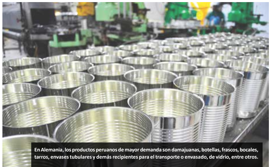
En Alemania, los productos peruanos de mayor demanda son damajuanas, botellas, frascos, bodegas, tarros, envases tubulares y demás recipientes para el transporte o envasado, de vidrio, entre otros.

En este encuentro de negocios B2B los compradores extranjeros se reunirán con fabricantes nacionales de envases industriales, flexibles y laminados, envases de cartón, aluminio, hojalata, preformas PET, sacos de polipropileno y menaje doméstico. Por ello, con el propósito de contribuir con el crecimiento de las exportaciones del sector, la Cámara de Comercio de Lima está organizando dicho evento en coordinación con Promperú y la Sociedad Nacional de Industrias. Dicha misión contará con la participación de empresas importadoras de los siguientes países: Bolivia, Chile, Colombia, Costa Rica, Ecuador, El Salvador, Honduras y Estados Unidos. Se estima contar con la participación de más de 25 empresas peruanas exportadoras, las cuales sostendrán citas comerciales que generarán intenciones de negocios de hasta US$2 millones.