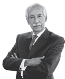
DR. CÉSAR PEÑARANDA CASTAÑEDA

Ocupó el puesto 96 entre 180 países; sin embargo, se debe perseverar en reducir y simplificar las regulaciones laborales y empresariales para disminuir los niveles de corrupción.