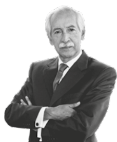
DR. CÉSAR PEÑARANDA CASTAÑEDA

Pese a mejorar cinco posiciones frente a la edición anterior de esta medición, Perú sigue rezagado al puesto 60° entre 113 países evaluados.