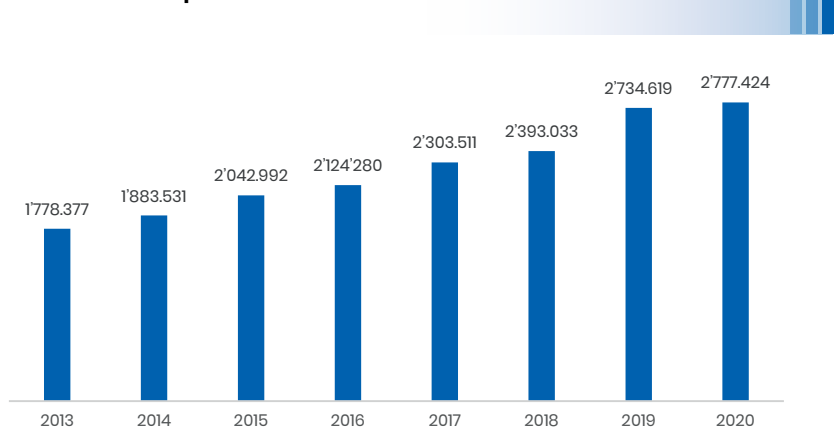
Número de Empresas 2013-2020

Es importante destacar que en todos los departamentos se registró un incremento de nuevos emprendimientos respecto al IV